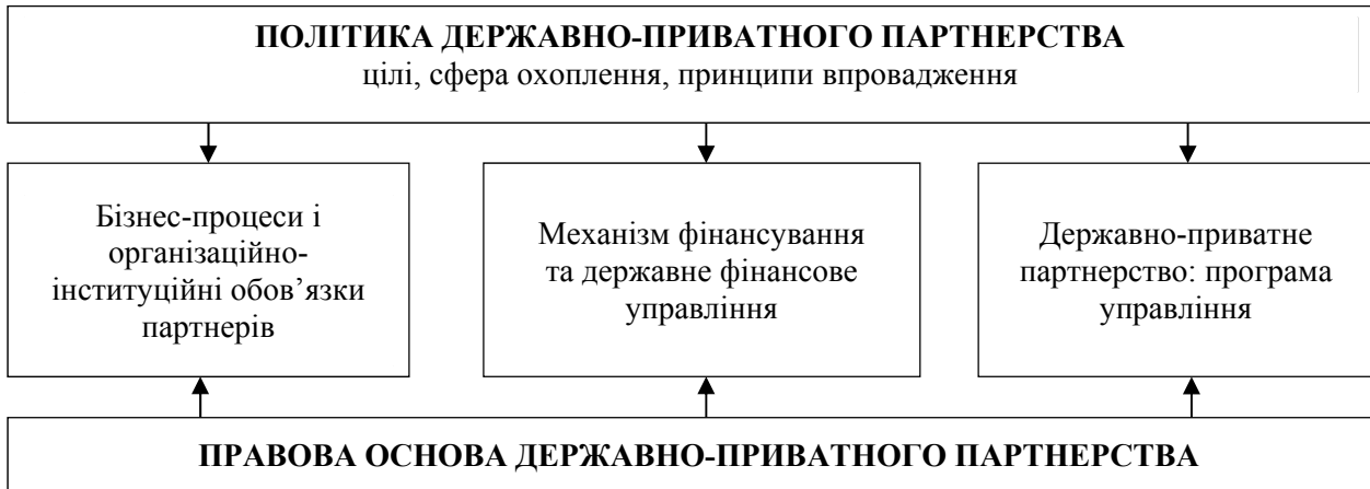
Рис. 1. Основа державно-приватного партнерства [3]

які регламентують діяльність приватного партнера в конкретних секторах економіки.