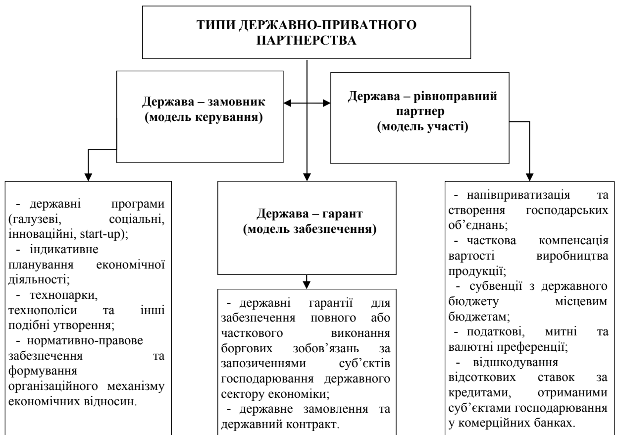
Рис. 3. Основні типи участі держави в рамках державно-приватного партнерства (розробка автора)

Запропоновані типи моделей державно-приватного партнерства ґрунтуються на визначенні як пріоритетної ролі держави.